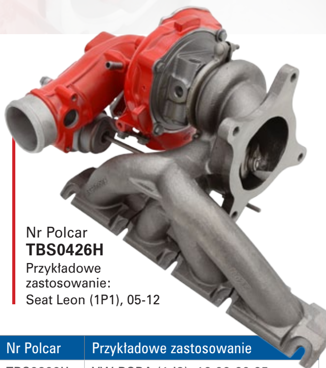
Nr Polcar TBS0426H Przykładowe zastosowanie: Seat Leon (1P1), 05-12